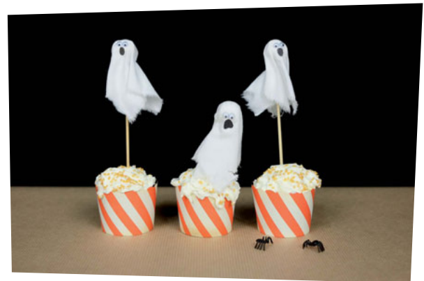
Étape 6 : Collez la bouche et les yeux.