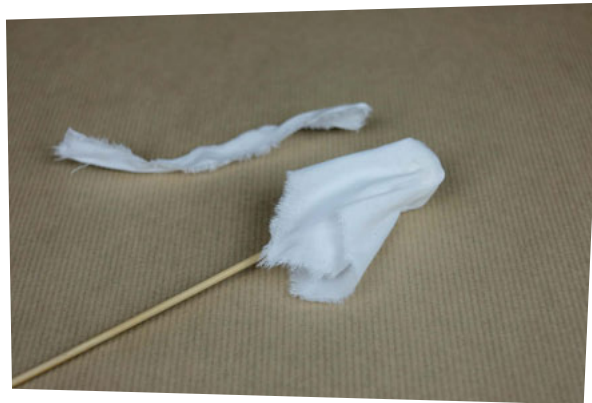
Étape 4 : Une fois sec, retirez le cordon de tissu.