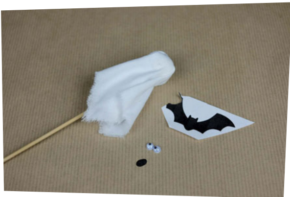
Étape 5 : Découpez une bouche dans le papier noir.